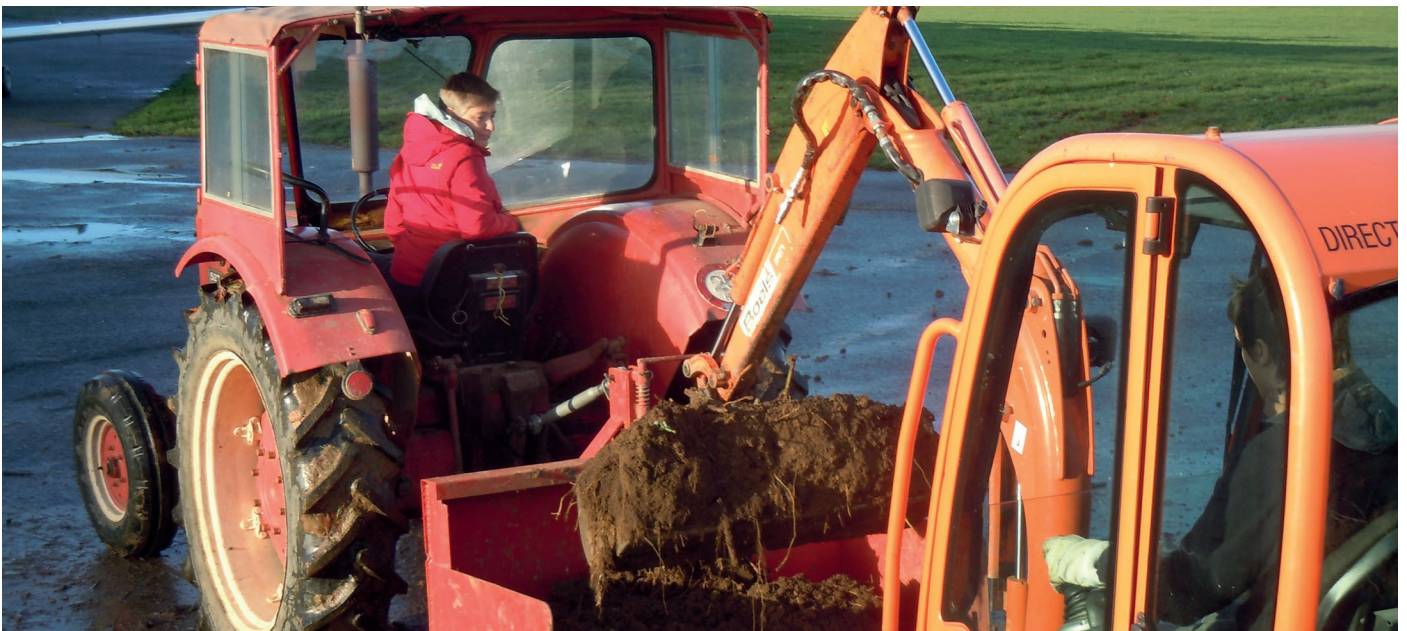
Net zoals vorig jaar werd een bobcat gehuurd om de goten langs de piste te reinigen en de gaten in de grasstroken te vullen.