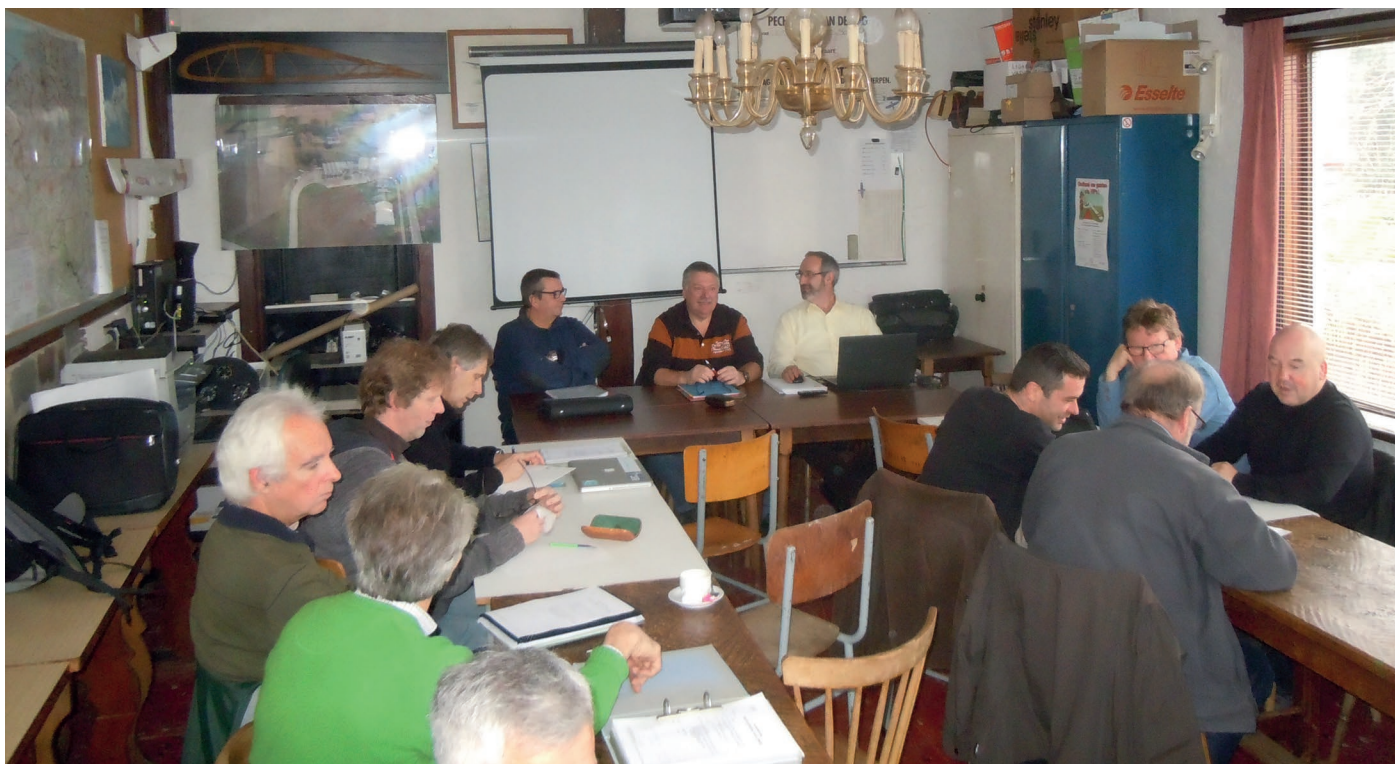
Vergadering "Raad van Instructeurs" van de Liga op 12 december

De beker Gerard De Praetere wordt jaarlijks uitgereikt aan de piloot met de langste vlucht met start in landing op het vliegveld van Goetsenhoven. Enkel vluchten van meer dan 3 uur die op de Charron.line worden geplaatst komen in aanmerking.