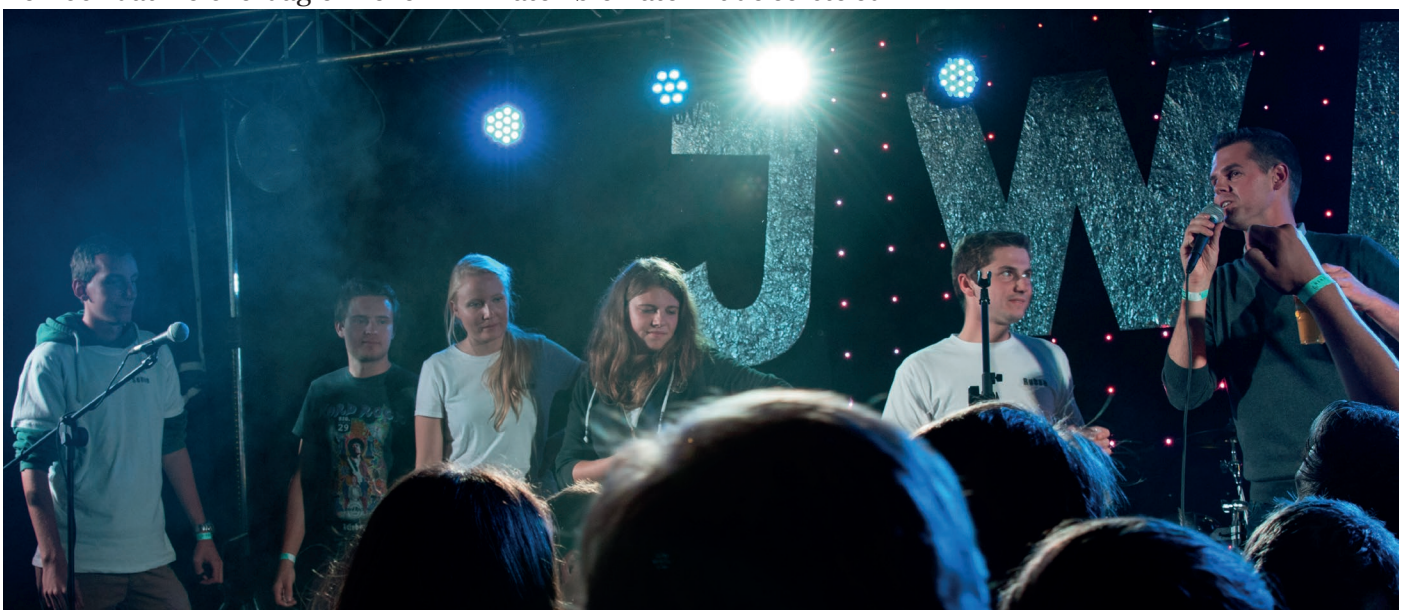
De organisatoren van het JWDW op het podium