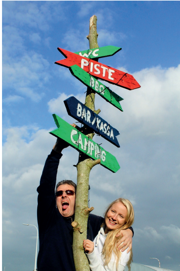
Zo raakt niemand de weg kwijt...

's avonds niets te kort kwamen van eten en drank. De vliegactiviteiten overdag heb ik voor mijn rekening genomen, samen met de website en inschrijvingen, affiches en wegwijzers.