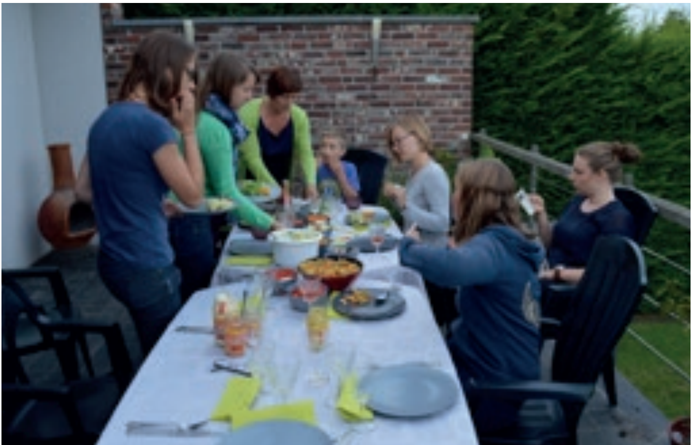
De ladies aan tafel...