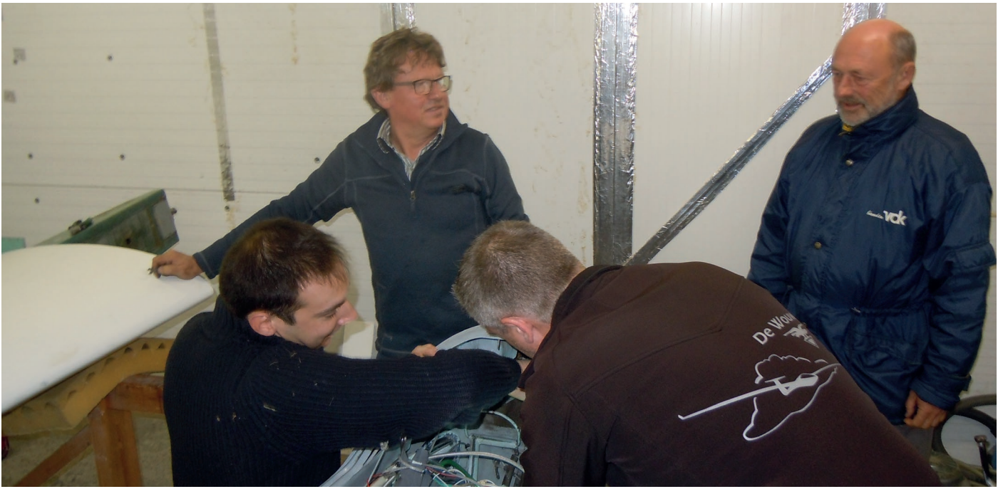
De SF34 kreeg dit jaar wat extra aandacht: de TOST-haken kregen een revisie, zoals verplicht na 2000 starts. Ook het remsysteem voor het hoofdwiel werd volledig vernieuwd.