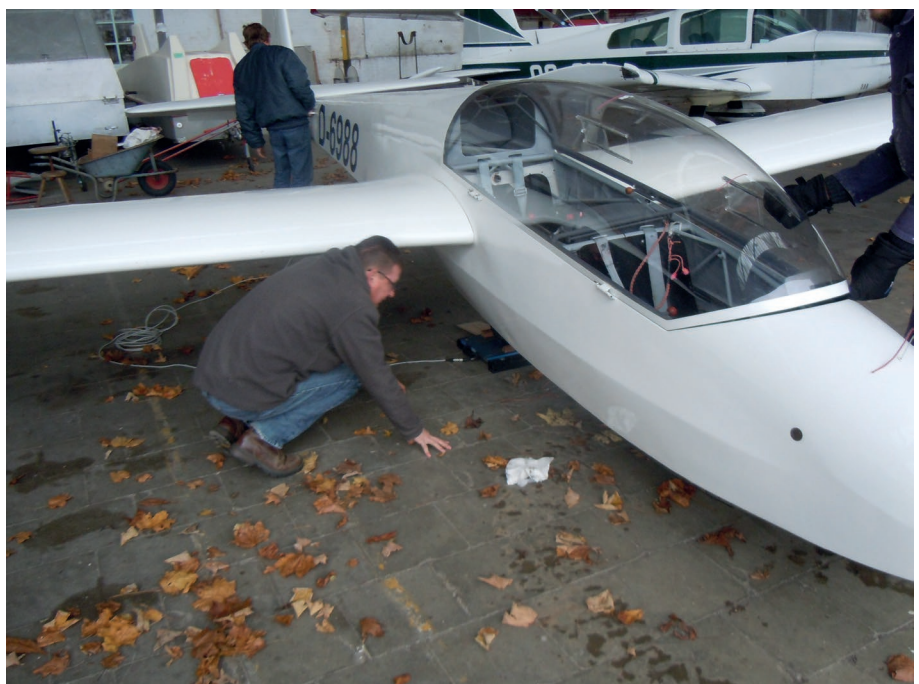
De ASK-13 '88' heeft nu ook een staartwiel. Er moest dus opnieuw een weegrapport opgemaakt worden...