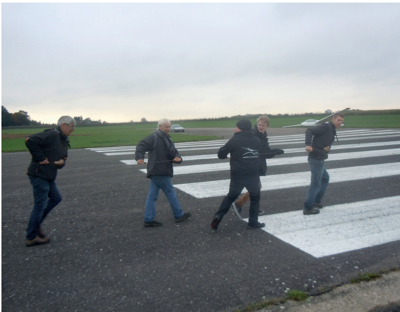
Uitrollen van de lierkabel dient soms ook met de hand te gebeuren...